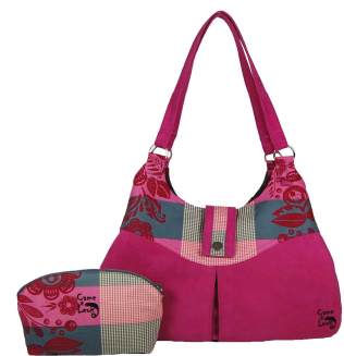
Hobo Apus in pinkem Wildleder

Temperamentvoller Frühlingsbeginn: Die Handtaschen von Came & Leon gibt es jetzt auch in exklusivem Wildleder. In leuchtendem Rubinrot oder frisch-floralen Frühlingsfarben ziehen die eleganten Begleiter beim Shopping oder beim ersten Besuch im Eiscafe die Blicke garantiert auf sich. Design, Größe, Form, Farbe, Henkel, Verschlüsse, Außen- und Innenleben: Die Kundinnen können auch die neuen Wildleder-Taschen nach ihren individuellen Vorstellungen im Online-Shop unter www.cameandleon.com selber designen. Die bestellten Unikate werden – wie bei Europas erstem Label für personalisierte Taschen üblich - in reiner Handarbeit made in Germany hergestellt. Inspirationen für die neue Wildleder-Kollektion liefert auch der Design-Shop von Came & Leon in Rottach-Egern.